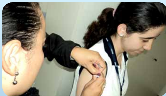
Funcionária da Secretaria Municipal de Saúde e do SEPREV

Os funcionários do SEPREV foram imunizados, no mês de junho, contra o vírus da gripe, pela equipe da Secretaria Municipal de Saúde, que realizou a ação nas dependências do SEPREV, o que permitiu adesão de 90% dos funcionários. Com isso o SEPREV contribuiu com a campanha e imunizou sua equipe contra o vírus da gripe.