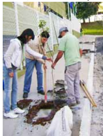
Equipe da Secretaria Municipal de Urbanismo e Meio Ambiente

O SEPREV promoveu, no início do mês de julho, o plantio de mudas de árvores nas áreas de sua sede, sendo cinco da espécie Ipê e uma da espécie Resedá. A proposta visa contribuir com a preservação do meio ambiente, e a ação contou com a colaboração da equipe da Secretaria Municipal de Urbanismo e Meio Ambiente, que foi responsável pelo plantio e pela doação das mudas. Vale lembrar que o SEPREV já realiza a coleta seletiva e pretende aumentar as ações de conscientização ambiental, adotando práticas que contribuam para o desenvolvimento sustentável.