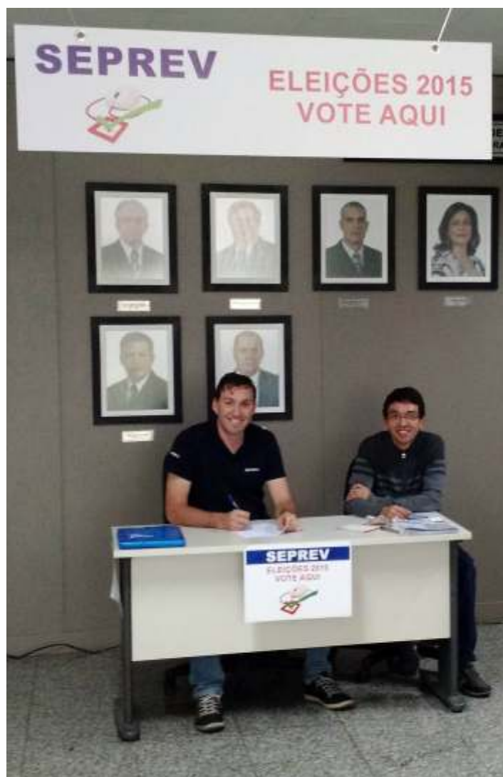
Seção eleitoral instalada no SEPREV funcionou durante os três dias