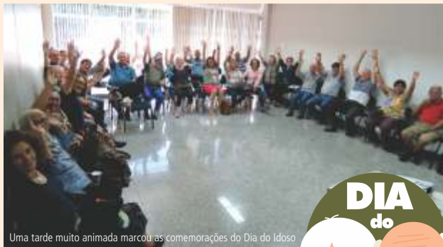
Uma tarde muito animada marcou as comemorações do Dia do Idoso